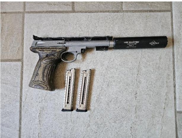
Pistolet Smith et Wesson, modèle 22S, avec silencieux RDS, avec 2 chargeurs 22 LR : 200€