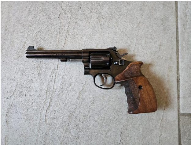
Révolver Smith et Wesson, modèle 14-2, calibre 38 spécial : 400€