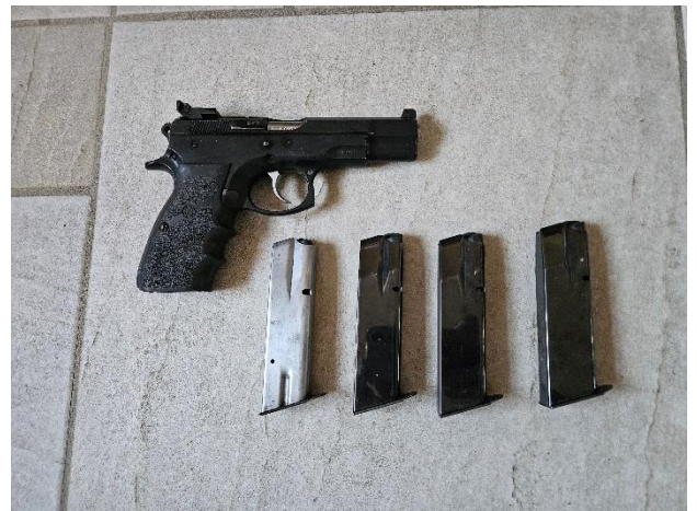
Pistolet CZ, modèle 75, calibre 9 Para, avec 4 chargeurs, canon très fatigué : 300€