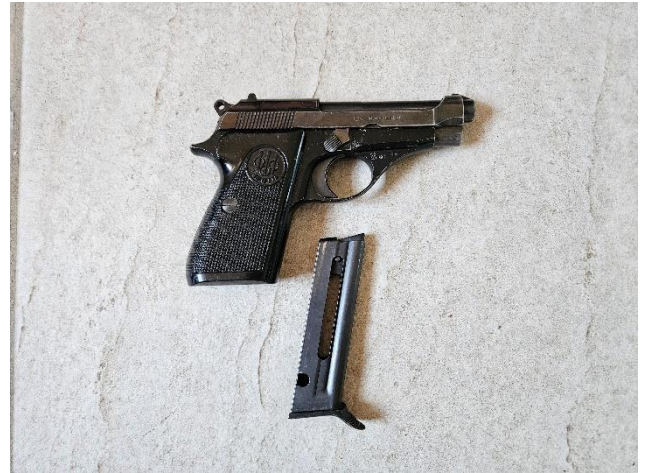
Pistolet Beretta, modèle 71, calibre 22 LR : 100€